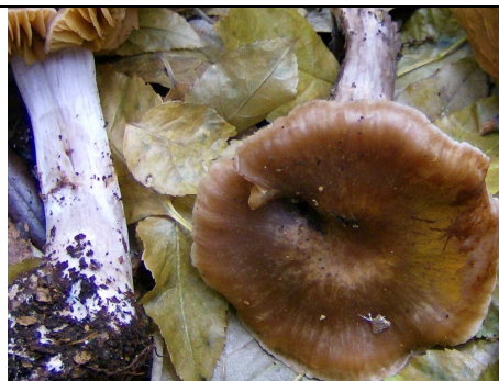
cappello e gambo in primo piano