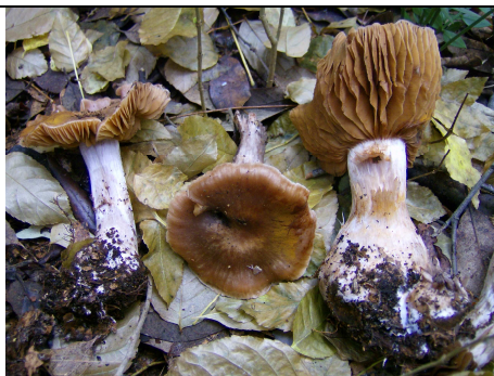
basidiomi in habitat

RILIEVI EFFETTUATI SU REPERTI FRESCHI SECCHI