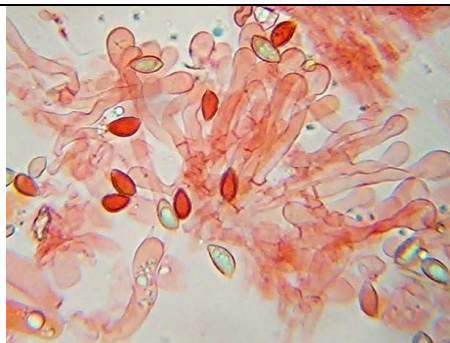
cheilocistidi, basidi e spore