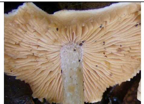
imenio e apice gambo