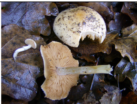
basidiomi in habitat

RILIEVI EFFETTUATI SU REPERTI FRESCHI SECCHI