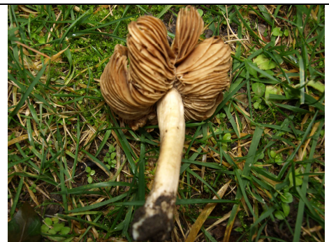
IMENOFORO E GAMBO