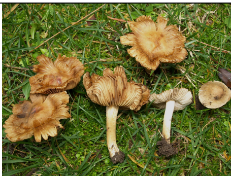
BASIDIOMI IN HABITAT

RILIEVI EFFETTUATI SU REPERTI FRESCHI SECCHI