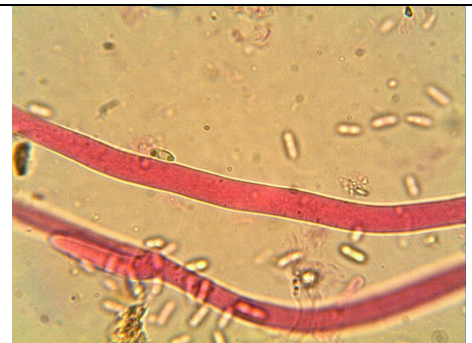
IFE DELLA GLEBA