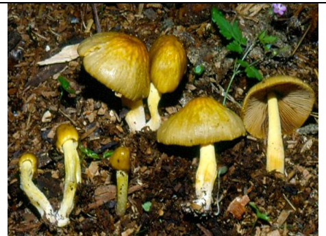
BASIDIOMI RACC. 29.06.96 LOC. SPIAZZO (VR) LESSINI - A CONFRONTO