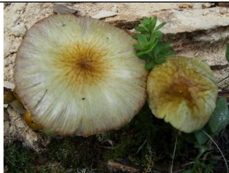
CAPPELLO RUGATO DA RETICOLO