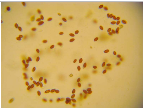
SPORE ELISSOIDI A PARETE SPESSA