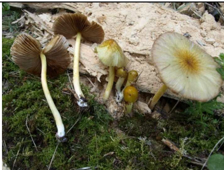
BASIDIOMI IN HABITAT CON PARTICOLARI: COLORE LAMELLE E DECORAZIONE CAPPELLO

RILIEVI EFFETTUATI SU REPERTI FRESCHI SECCHI