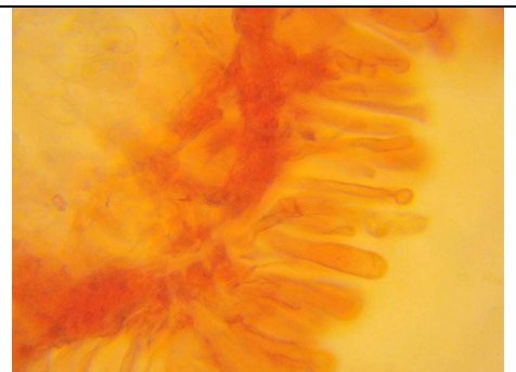
EPICUTE A PALIZZATA