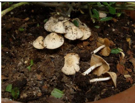
BASIDIOMI IN HABITAT - RACCOLTA 08.07.10

RILIEVI EFFETTUATI SU REPERTI FRESCHI SECCHI