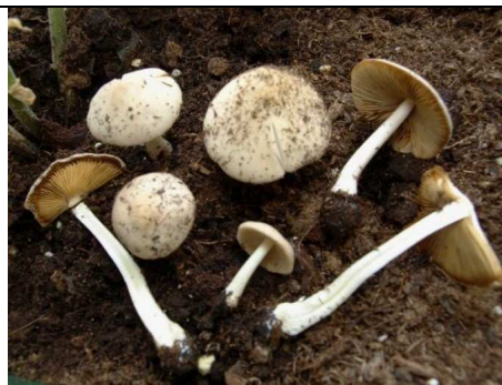
BASIDIOMI IN HABITAT - RACCOLTA 06.08.10