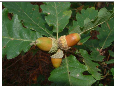
HABITAT GENERICO: ROVERELLA