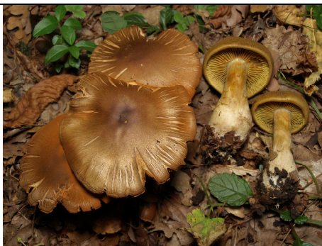
BASIDIOMI IN HABITAT

RILIEVI EFFETTUATI SU REPERTI FRESCHI SECCHI