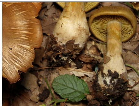
IMENOFORO E GAMBO BULBOSO