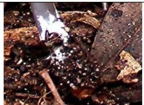
estrema base del gambo rossa