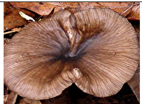
cappello in primo piano