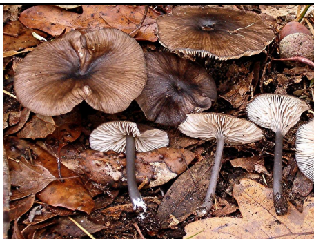
basidiomi in habitat

RILIEVI EFFETTUATI SU REPERTI FRESCHI SECCHI