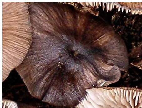
cappello e squamuline in primo piano