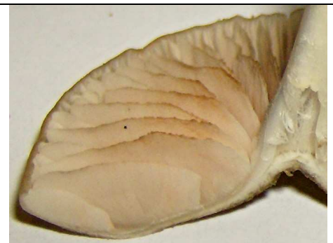
fillo con tendenza a imbrunire