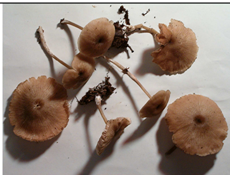
raccolta del 2005

RILIEVI EFFETTUATI SU REPERTI FRESCHI SECCHI