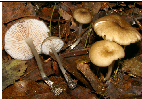
raccolta del 2010 - ritaglio di foto di A. Cappelli