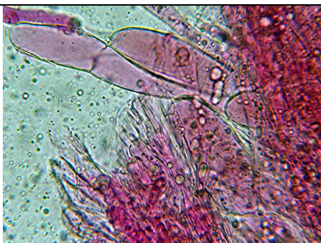
epicute verso il disco in floxina con pigmento intracellulare