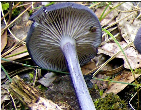
gambo con flocculi scuri e lamelle bianche a filo concolore

RILIEVI EFFETTUATI SU REPERTI FRESCHI SECCHI