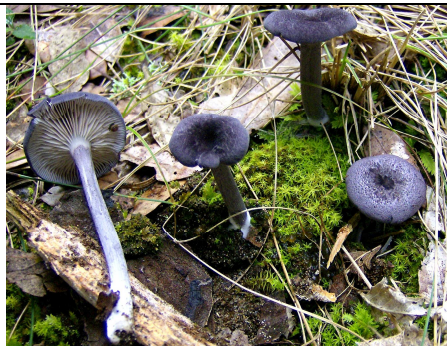
basidiomi in habitat