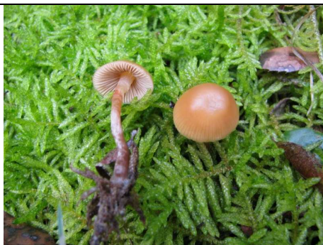
BASIDIOMI IN HABITAT

RILIEVI EFFETTUATI SU REPERTI FRESCHI SECCHI