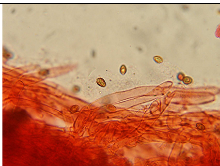
EPICUTE SUBGELIFICATA IN ROSSO CONGO