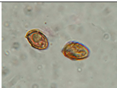
SPORE VERRUCOSE, CON PLAGA ILARE LISCIA, UN PO' CALIPTRATE