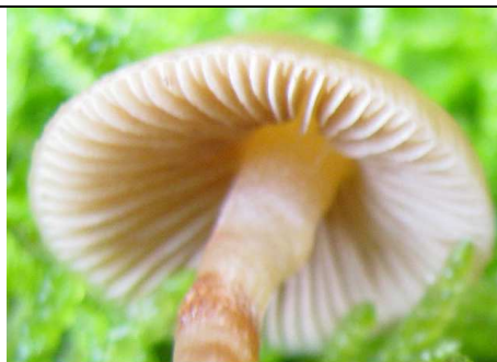
IMENOFORO, GAMBO CON RESIDUO ANULARE