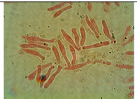
BASIDI E BASIDIOLI