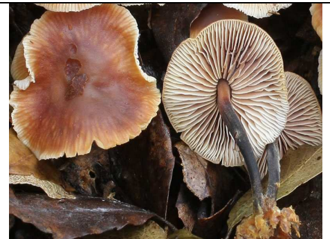
PARTICOLARI CAPPELLO E GAMBO