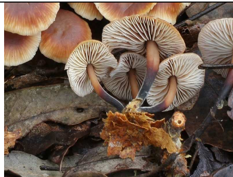
IL SUO NUTRIMENTO