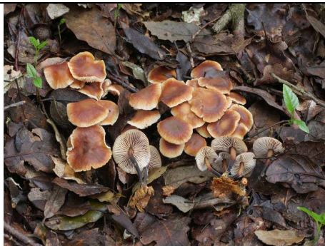
CARPOFORI IN HABITAT

RILIEVI EFFETTUATI SU REPERTI FRESCHI SECCHI