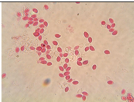
SPORE A 1000 INGRANDIMENTI