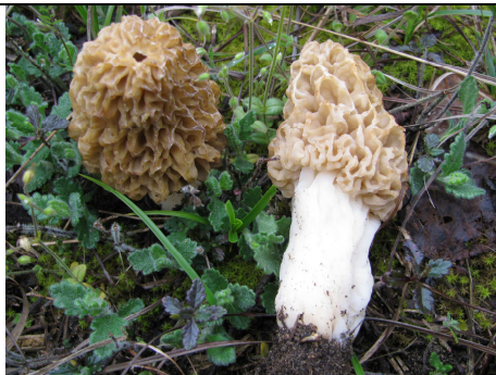
CARPOFORI IN HABITAT

RILIEVI EFFETTUATI SU REPERTI FRESCHI SECCHI