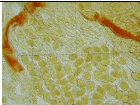
ASCHI CON SPORE E CISTIDI