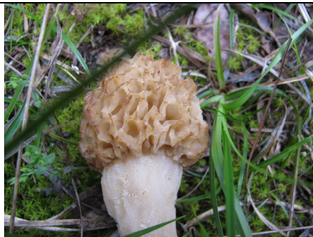
MITRA E GAMBO