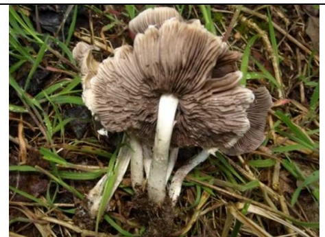
GAMBO E LAMELLE