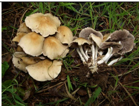
BASIDIOMI IN CESPO

RILIEVI EFFETTUATI SU REPERTI FRESCHI SECCHI