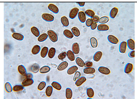
SPORE IN KOH 5%