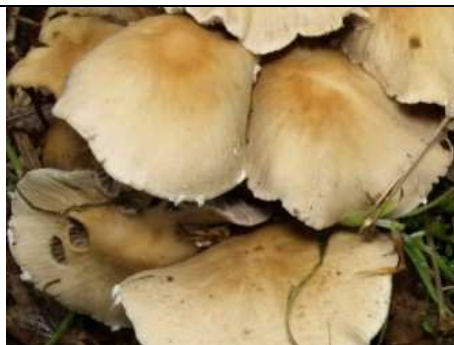
DETTAGLIO DEL VELO APPENDICOLATO