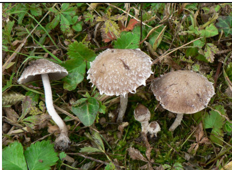
Basidiomi in habitat

RILIEVI EFFETTUATI SU REPERTI FRESCHI SECCHI