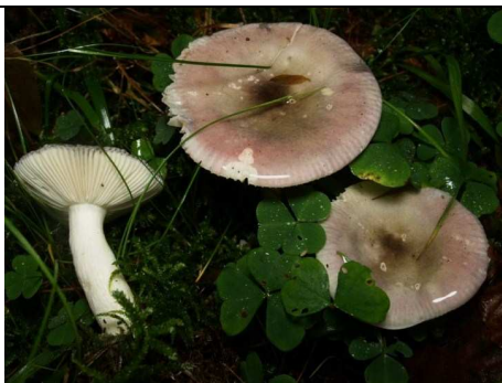
BASIDIOMI IN HABITAT

RILIEVI EFFETTUATI SU REPERTI FRESCHI SECCHI