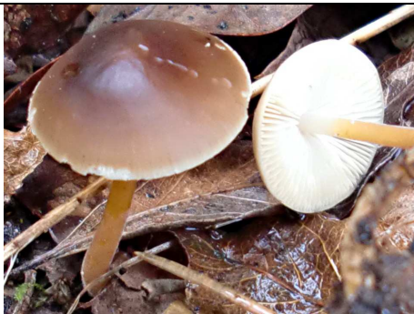
BASIDIOMI IN PRIMO PIANO

RILIEVI EFFETTUATI SU REPERTI FRESCHI SECCHI