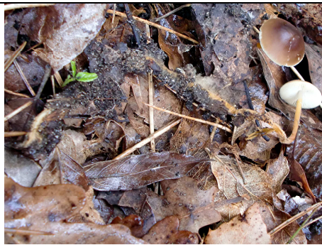
GAMBO LUNGAMENTE INTERRATO