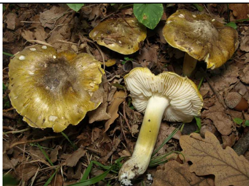
CARPOFORI IN HABITAT

RILIEVI EFFETTUATI SU REPERTI FRESCHI SECCHI