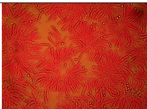
Spore e basidioli