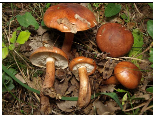
CARPOFORI IN HABITAT

RILIEVI EFFETTUATI SU REPERTI FRESCHI SECCHI