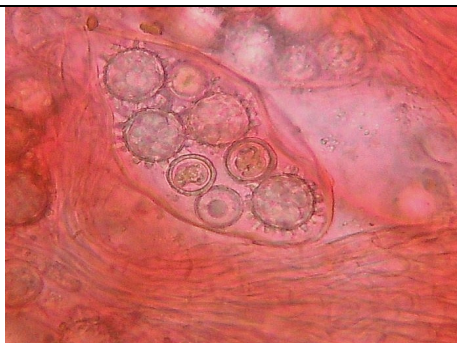
ASCO E SPORE