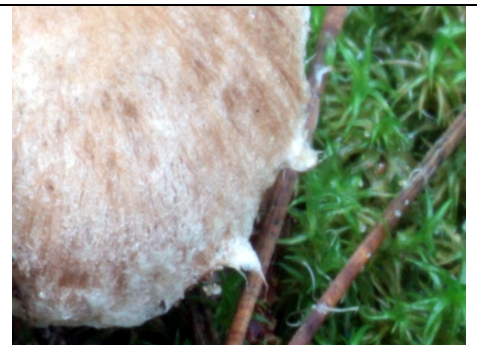
PARTICOLARE DEL VELO MARGINALE