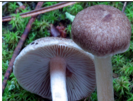
CAPPELLO E LAMELLE