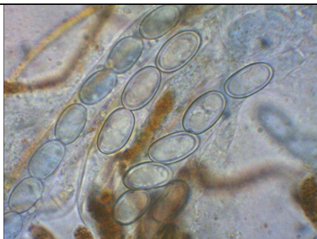
ASCHI E SPORE