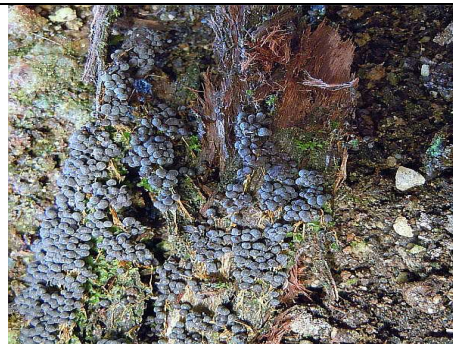
SPORANGI IN HABITAT