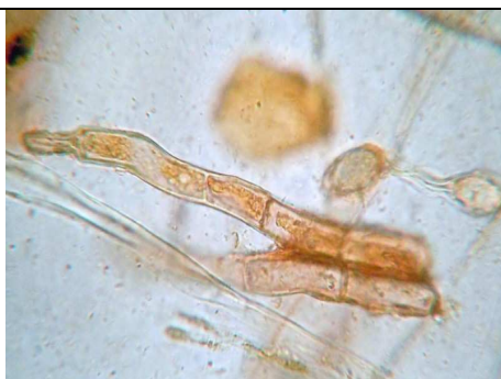
PELI SUPERFICIE ESTERNA