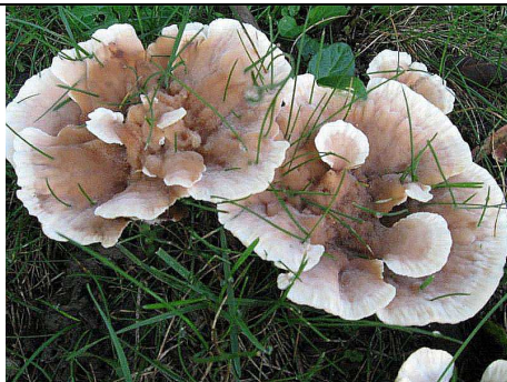
BASIDIOMI IN HABITAT

RILIEVI EFFETTUATI SU REPERTI FRESCHI SECCHI