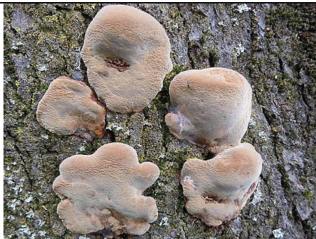
SPOROFORI IN HABITAT

RILIEVI EFFETTUATI SU REPERTI FRESCHI SECCHI