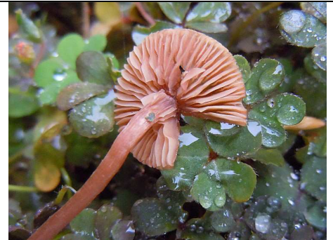
GAMBO E IMENIO