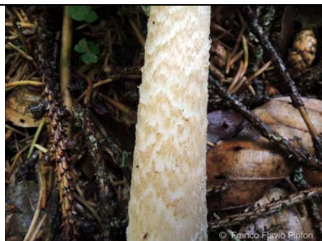
AMANITA BATTARRAE GAMBO