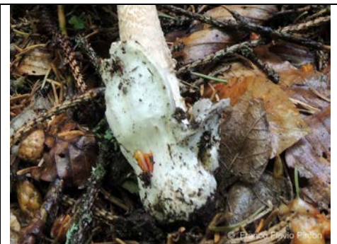
AMANITA BATTARRAE VOLVA