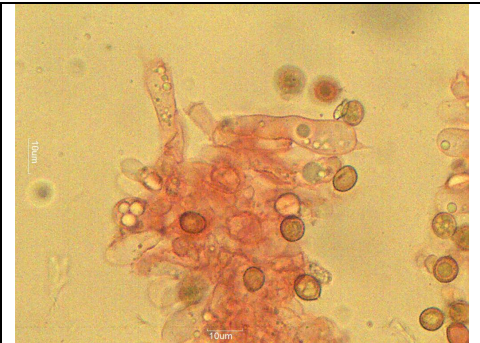
BASIDIO, BASIDIOLIO E SPORE A 1000 X