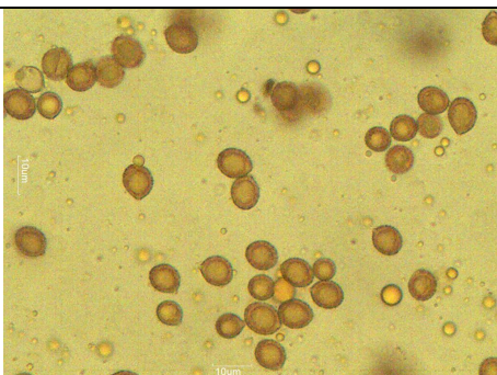
SPORE 1000 X