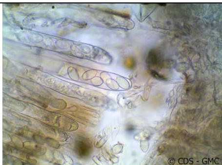
ASCO CON SPORE