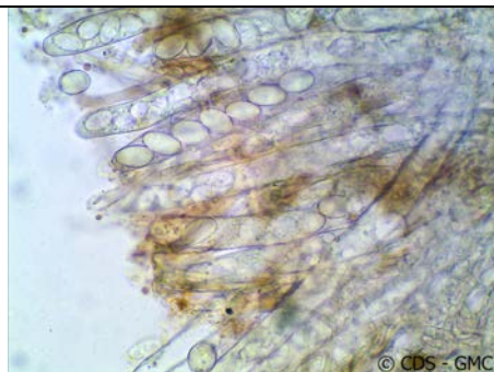
ASCO CON SPORE