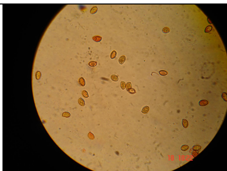
SPORE 1000 X