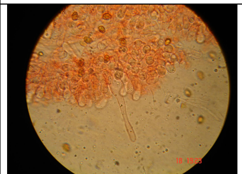
PLEUROCISTIDIO 1000 X