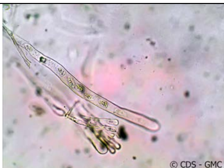
ASCO CON SPORE