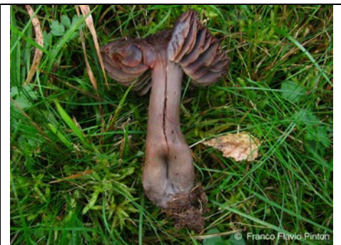
HYGROCYBE OVINA 2