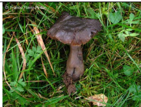
HYGROCYBE OVINA 1