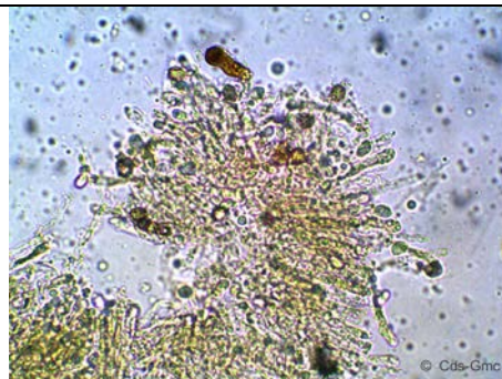
SPORE + CHEILOCISTITI