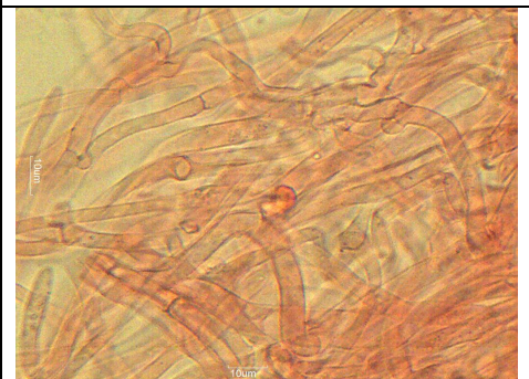
GIUNTI A FIBBIA 1000 X