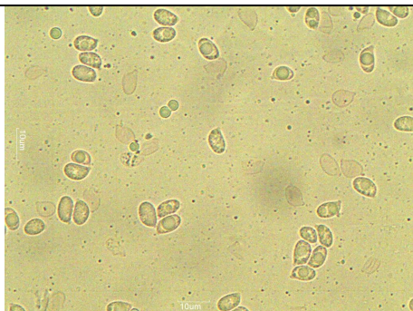
SPORE 1000 X