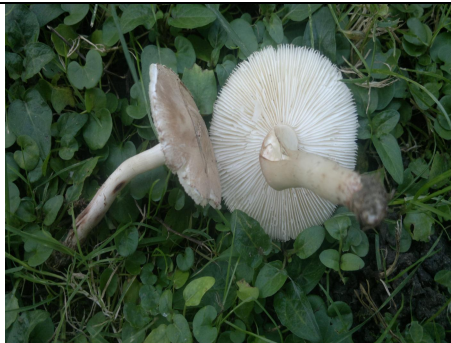
PH. L. TEGON