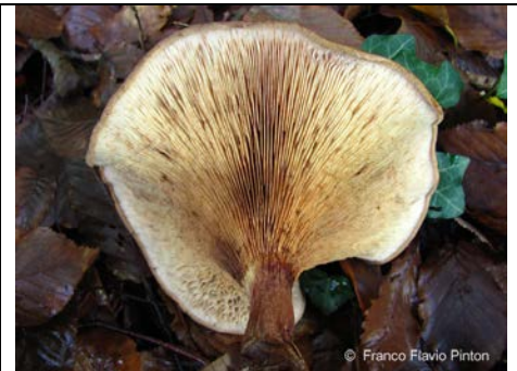
PAXILLUS FILAMENTOSUS 3