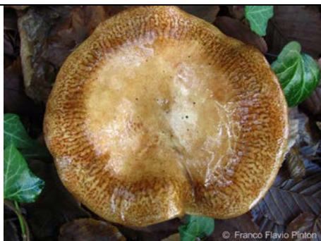
PAXILLUS FILAMENTOSUS 4