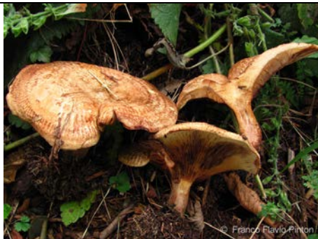
PAXILLUS FILAMENTOSUS 1

RILIEVI EFFETTUATI SU REPERTI FRESCHI SECCHI