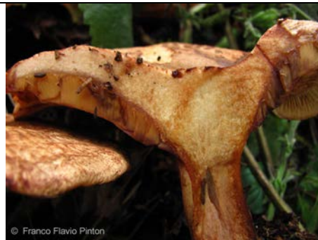
PAXILLUS FILAMENTOSUS 2