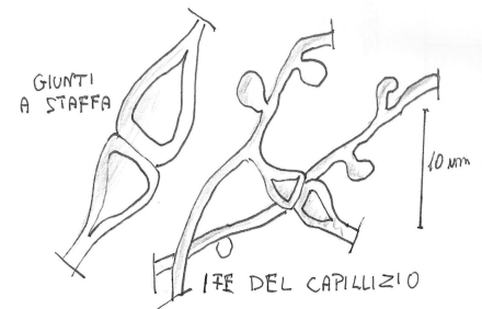
GIUNTI A STAFFA E IFE